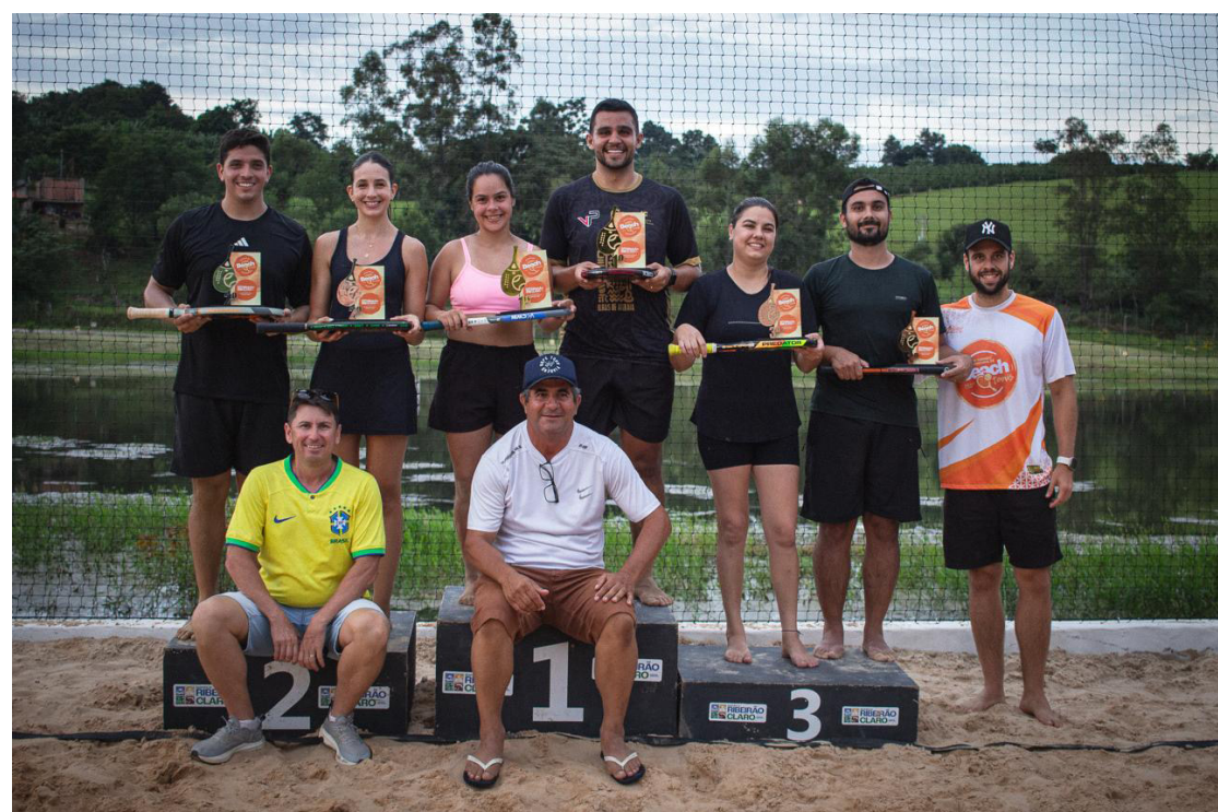
Vencedores da categoria E mista